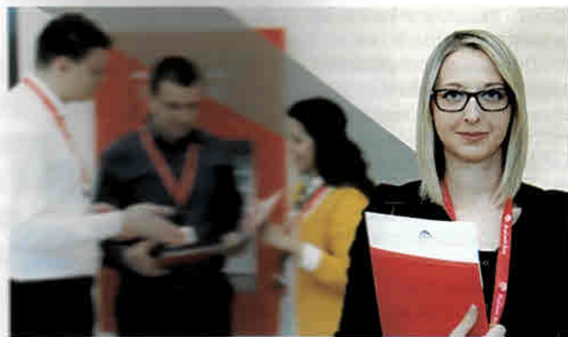
ProCredit želi pomoći znanje i iskustvo mladim ljudima

“Mi podržavamo ovaj novi dualni program u okviru Skills Expert Programa, koji finansira Savezno ministarstvo za privredu i energiju SR Njemačke. To znači da