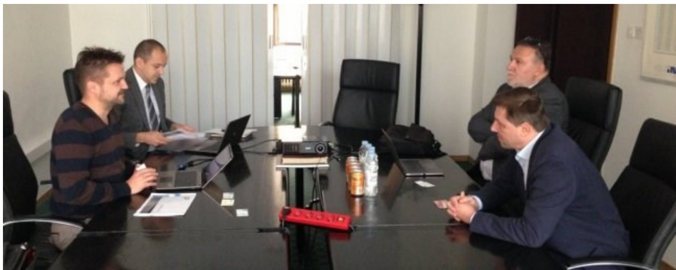
Predstavnici Energopetrola d.d. Sarajevo i Udruženja poslodavaca FBiH

U petak 31.05.2013. je održan sastanak između predstavnika Udruženja poslodavaca Federacije Bosne i Hercegovine sa jedne i predstavnika Energopetrola d.d. Sarajevo ( članica Mol grupacije) sa druge strane.