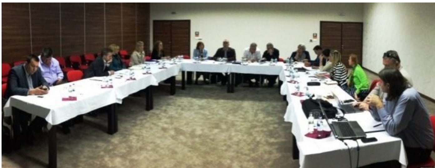
Članovi Radne grupe za izradu Zakona o privrednim društvima

Postojeći Zakon o privredim društvima FBiH je sadržavao niz otežavajućih okolnosti za razvoj privrede u Federaciji, no prema potrebi da se isti zakon poboljša kako zbog opšteg poboljšanja stanja u privredi, tako i zbog međunarodnih obaveza koje uključuju i izmjenu principa i standarda u ovom zakonu. Radna grupa je nakon dvodnevne sesije i značajnog dijela koji je prerađen zakazala novi sastanak polovinom juna, na kojem će se nastaviti sa radom na zakonu sve dok u konačnici Zakon ne krene u procedure rasprave i usvajanja.