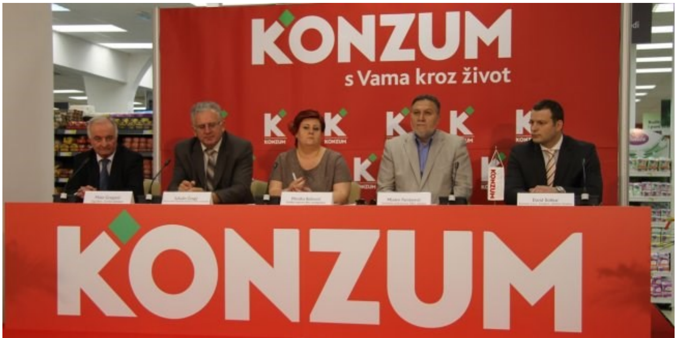
Predstavnici UP FBiH, Sindikata trgovine BiH, Konzuma d.d. Sarajevo i Agrocora

Dana 27.maja 2013. godine u Sarajevu Udruženje poslodavaca FBiH i Sindikat trgovine BiH potpisali su Memorandum o razumijevanju i saradnji o pitanjima bitnim za djelatnost trgovine i usluga u FBiH. Potpisivanje memoranduma upriličeno je u prostorijama „Konzuma“ d.d. u Sarajevu.