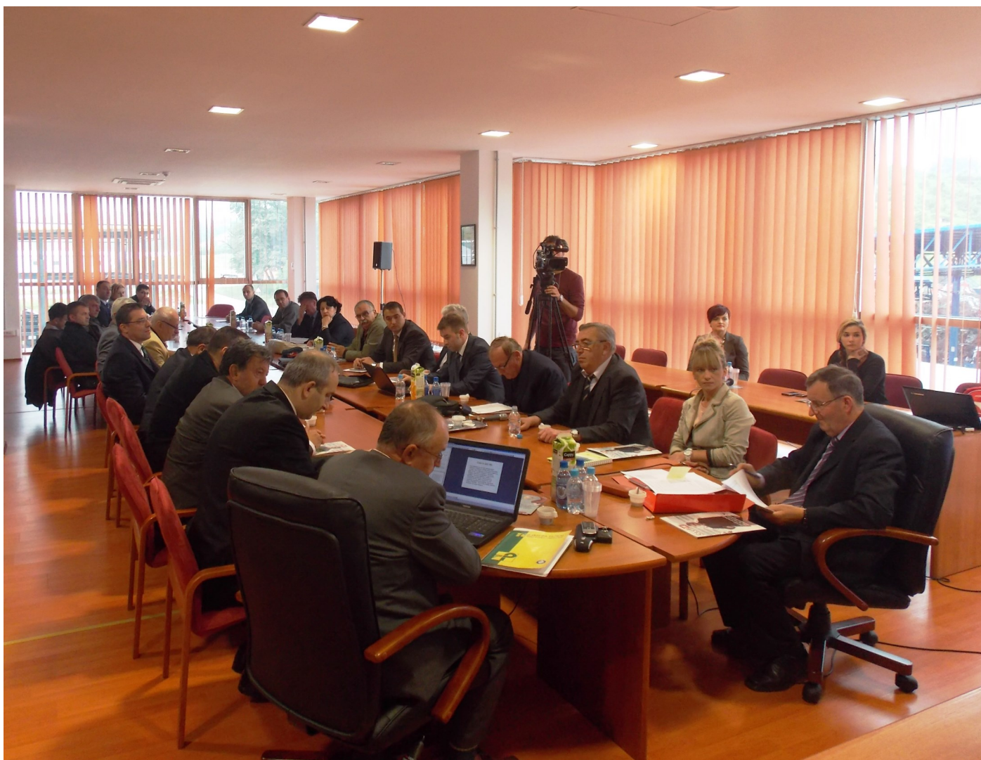
Članovi XII proširene sjednice Upravnog odbora UP FBiH

Cijene koje stoje u odluci su pažljivo određene nakon istraživanja tržišta za oglašavanje na web stranicama koje imaju indikator posjete, te je u svrhu promovisanja kako UPFBiH, tako i njegovih članica određena cijena koja je na web marketing i PR tržištu apsolutno konkurentna i najpovoljnija, a po indikatoru broja pregleda web stranice na dnevnoj, sedmičnoj i mjesečnoj osnovi.